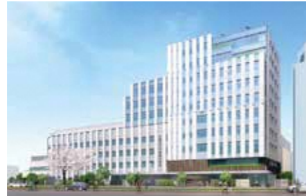
▲みらいステップなかのの完成予想図