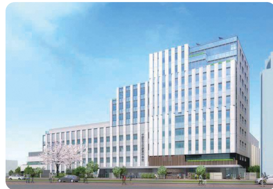
▲複合施設(中央1-41-2)の完成予想図