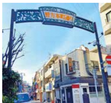
◀「わたしの中野30分」グランプリ受賞作品

SNSの投稿でプレゼントが当たる「ナカノめぐらんぷり」。「押し麺くじ」と「わたしの中野30分」をテーマにそれぞれ写真と動画を募集し、3月10日にグランプリを決定しました。