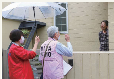
住民同士の支えあ いなど地域活動を 支援します▶