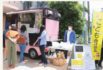
◀子ども食堂や学 習支援を充実させ ます