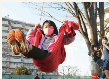
自由に創造できる遊び 場「プレーパーク」の 普及啓発を図ります▶