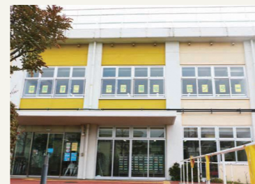
◀すこやか福祉センター を4か所から5か所に 増やします