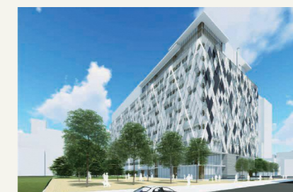
▲区役所新庁舎完成イメージ図