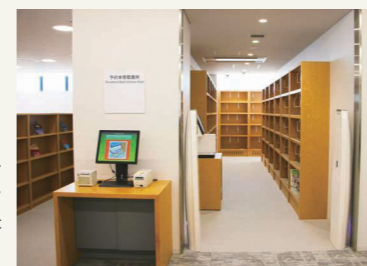
非接触で本を受け 取れるようにします (写真は中野東図書 館の予約室)▶