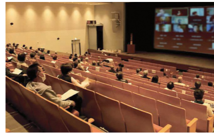
▲会場はなかのZERO小ホール他

申込み 電子申請か、往復ハガキで、公益活動推進係へ。4月15日必着。抽選で200人 ☆記載事項などについて詳しくは、区HPか、区民活動センターや図書館などで配布中の募集案内または3月27日発行の生涯学習スポーツ情報紙「ないせす」4月号をご覧ください