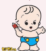
▲国勢調査のイメージキャラクター「センサスくん」