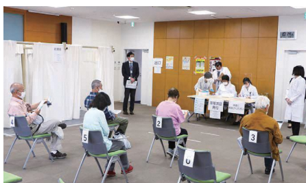
▲中野区医師会館での集団接種の様子