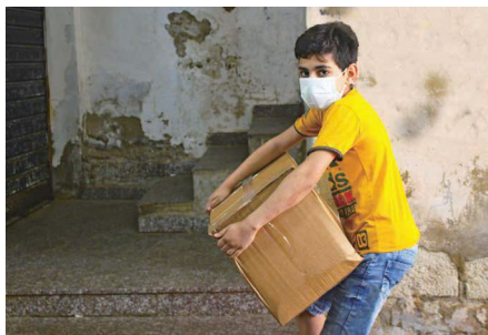
▲山間部の困窮する難民家族への食料支援(レバノン)