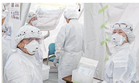
▲医師会と区が連携して設置したPCR検査センター

中野区医師会は団結力があり、熱心な医師が多いのが特徴です。医師だけでなくさまざまな職種の人と、地域のみなさんの健康を守るというゴールを目指して今後も連携していきます。