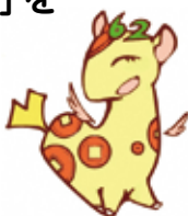
▲個人住民税PRキャラクター「ぜいきりん」

東京都と都内区市町村は、原則として全事業主を「特別徴収義務者」に指定しています。事業主のみなさんは、ご理解・ご協力をお願いします。