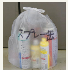
▲中身を明記してください

これらのごみを出す場合は、他のごみとは別の袋に入れ、中身が何かを明記して「陶器・ガラス・金属ごみ」の日にごみ集積所へ出してください。☆スプレー缶などに穴を開けると危険です。できるだけ中身を使い切り、穴を開けずに出してください