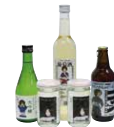
▲中野酒販協同組合も出店。ナカノさんとコラボレーションしたお酒も販売