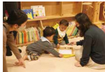
▲「もりのいえ」でくつろぐ親子