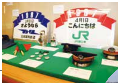
▲130周年を記念して歴史民俗資料館で行われた特別展