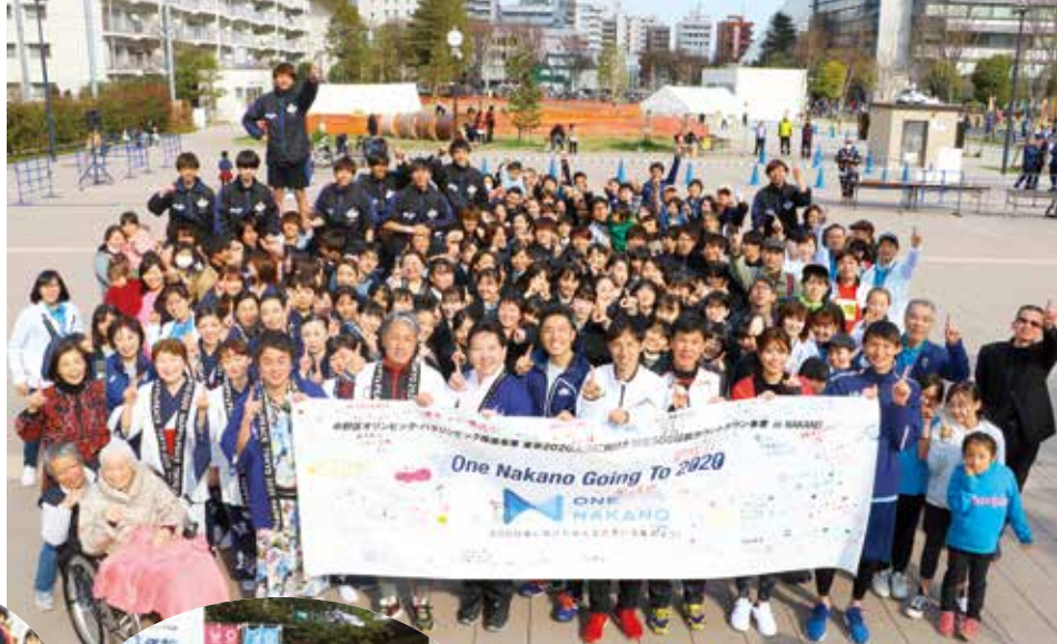
▲3月の500日前カウントダウンイベント