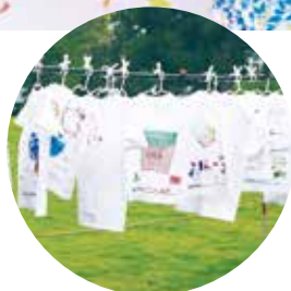
▲9月のワークショップ「なかのカラフルキッズ」の一コマ。左は完成したTシャツ