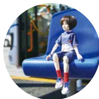
▲2月に誕生した「中野大好きナカノさん」

シビックプライド(区への愛着や誇り)の向上のため、さまざまな企画やイベントを行いました。7月には、「中野が好きです会員」を募集開始。