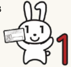
▲マイナンバーキャラクター「マイナちゃん」

☆住民基本台帳カードでのe-Tax利用は、昨年12月に終了しています。ご注意ください