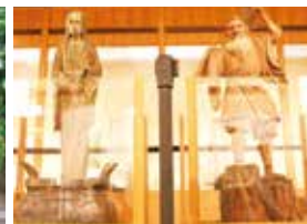
▲哲学堂公園哲理門(左)とそこに収められていた幽霊と天狗の像(右)