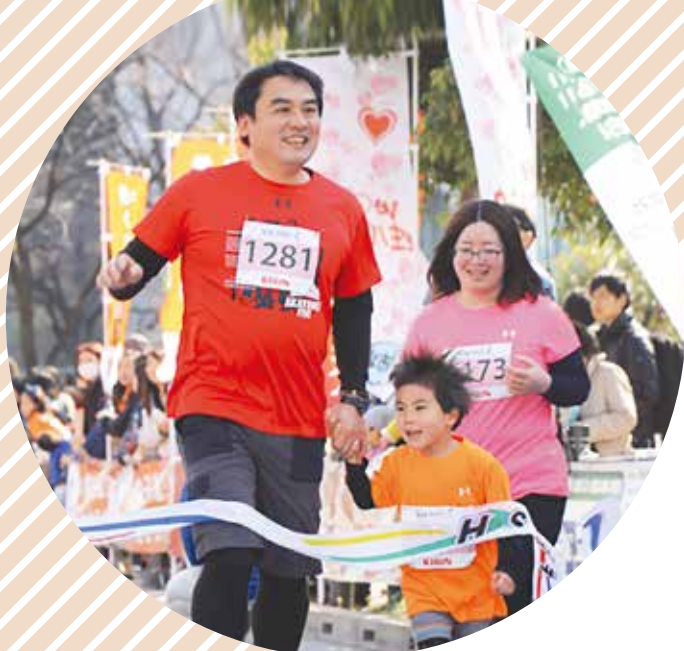
▲3月に行われた中野ランニングフェスタ