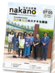
▲7月から、区報がオールカラーにリニューアル