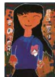
中野区入選作品。東京都入選にも選出