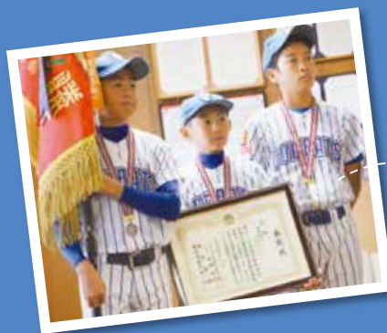
8月30日、祝・初優勝！中野コンバッツが区長、教育長に活躍を報告