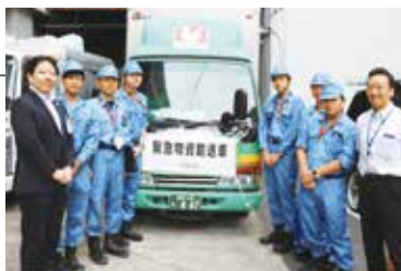
▲千葉県館山市へ職員を派遣し、支援物資を届けました