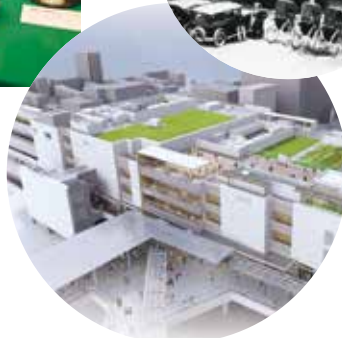
▲昭和4年(1929年)の中野駅(上)、10月に公表した西側南北通路・橋上駅舎等のイメージ図(下)