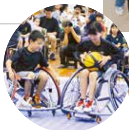
▲車いすバスケットの体験

来年の東京2020大会に向けて、カウントダウンイベントや体験イベントなどを行いました。