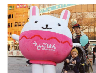
▲昨年はうさごはんも登場

午後4時~5時、中野駅北口駅前広場で、啓発用のマスクなどを配布。児童虐待防止を呼びかけます。