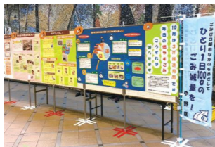
▲昨年の展示の様子

①区役所1階区民ホール=9月30日(月)~10月4日(金) 午前8時30分~午後5時(最終日は4時まで)、②中野駅 ガード下ギャラリー「夢通り」=10月15日(火)午前 10時~31日(木)午後3時 ☆いずれも当日直接会場へ。 ①のみ、「なかのエコポイント」50ポイントを贈呈