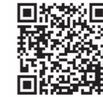
▲こちらからアクセス可

問合せ 「羽田空港のこれから」に関する電話窓口☎0570(001)160(ナビダイヤル) ☆IP電話からは☎(5908)2420へ