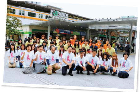
▲昨年の街頭キャンペーン

乳がんや検診に関する知識を深め、定期的な受診を心掛けましょう。★いずれも、当日直接会場へ