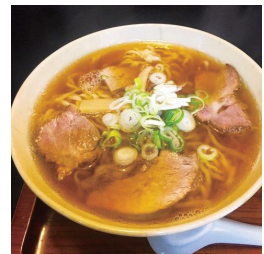
▲喜多方ラーメンの昼食も(料金は自己負担)