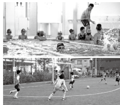
▲体育館などの他、南部には温水プール、中部には屋外運動広場も

会員になると、一般の半額程度でスポーツ・コミュニティプラザを利用でき、各種教室・講座等の「地域スポーツクラブ事業」にも参加可能。会員登録料(1年間)は、個人会員500円、団体会員1,000円で、区内在住・在勤・在学の方(団体会員はメンバーの半数以上が該当)が対象。各スポーツ・コミュニティプラザ窓口で手続きできます。登録必要書類などについて詳しくは、区HPをご覧ください。下記の各施設へ問い合わせを。☆スポーツ・コミュニティプラザは、下記の施設の他、来年4月、鷺宮にも開設予定です