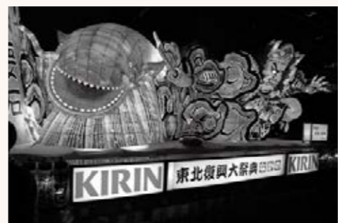
▲27日・28日の「東北復興大祭典なかの」で、迫力あるねぶたの運行