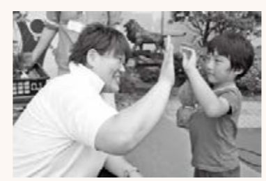
▲ゲストアスリートの一人、ロンドンオリンピック女子柔道銀メダリスト 杉本美香さんとハイタッチ

14日 東京2020オリンピック・パラリンピック競技大会に向けた2年前カウントダウンイベントを開催