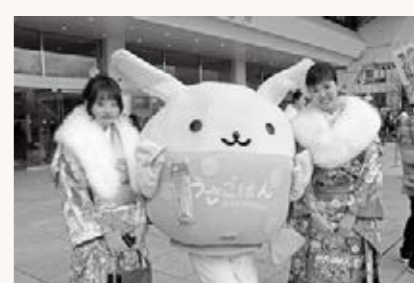
▲中野区食育マスコットキャラクター「うさごはん」と撮影する新成人