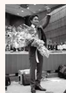
▲多くの区民が駆けつけました