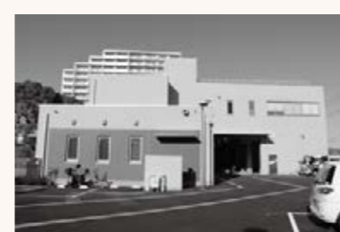
▲清掃事務所車庫が弥生町6-1-3に移転し、南中野事業所としてオープン