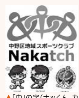
▲「中」の字(ナックン、カノちゃん、チスポン)が腕を組んだロゴ