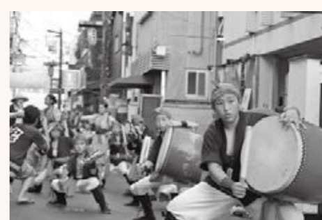
▲商店街を練り歩くエイサー団体