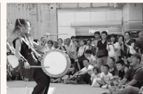
▲6日・7日の「にぎわいフェスタ」で、和太鼓の力強い演奏

◆区内の各地でイベント開催にぎわいフェスタ、なかのまちめぐり博覧会、東北復興大祭典なかの(など)