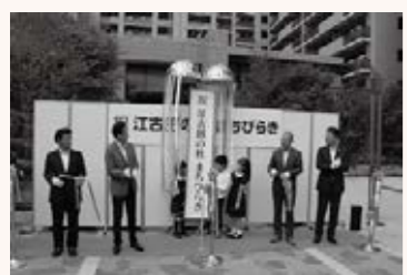
▲高齢者向け住宅や保育所など、誰もが暮らしやすい生活環境を整備(UR都市機構による大規模複合開発)