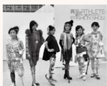
▲花やライトの飾り付けなど、工夫を凝らした義足の数々

18日 義足のアスリート達によるファッションショーと車いすバスケットボール体験会開催