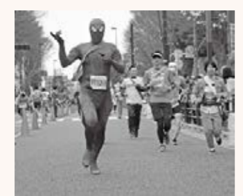
▲同日には「中野ランニングフェスタ」も開催

20日 「マチマチfor自治体」に関する協定を締結。地域限定版SNS「マチマチ」で身近な地域情報を発信