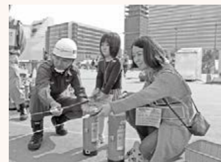
▲消火器的当てなど体験型の訓練をスタンパラリー形式で気軽に体験