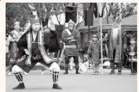
▲アイヌと沖縄の伝統儀式・芸能を披露