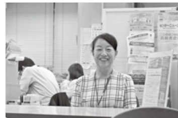
必要に応じて、個室で話を伺います▶

☆電話や電子メール、ファクシミリでも相談可。詳しくは、犯罪被害者等相談支援窓口にお問い合わせを