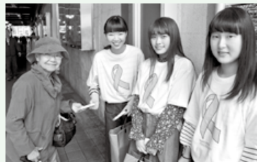
▲昨年の街頭キャンペーンでティッシュを配る新渡戸文化学園の学生

ピンクリボン運動とは、乳がんの正しい知識を広め、乳がん検診の受診を推進することなどを目的として行われる世界規模の啓発キャンペーン。1980年代にアメリカで始まり、そのシンボルとしてピンクリボンが使われています。