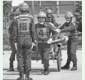
▲大会で訓練の成果を披露