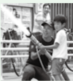
▲やさしく教えます