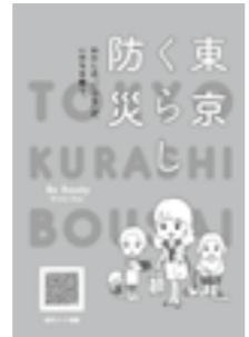
▲B6判164ページ、ピンク色の表紙が目印です

東京都作成のこの冊子は、女性の視点や発想を生かして日頃の暮らしの中でできる防災対策をまとめた1冊です。区民活動センター、図書館、すこやか福祉センター、区役所等で無料配布中。ぜひ、活用してください。