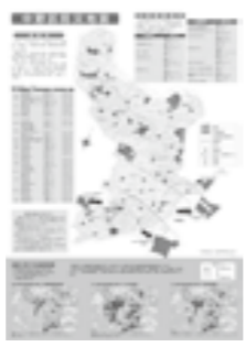
▲町丁別の地域危険度も最新の情報を掲載

避難所、地震に関する地域危険度などを確認できます。区民活動センター、すこやか福祉センター、区役所等で配布。区HPでもご覧になれます。 ☆英語版・中国語版・ハンガール版もあり