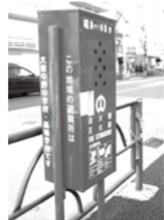
▲街頭消火器は区内に6,000本以上設置。側面には、近くの避難所を表示しています

自宅から離れて避難する場合は、通電火災(停電が復旧したことにより発生する火災)を防ぐため、自宅のブレーカーを切って避難しましょう。揺れを感じて自動的にブレーカーを切る「感震ブレーカー」も効果的です。