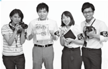
▲私たちが編集しています

紙面を大幅に刷新し、タブロイド判からA4判に。同時に、ポストिंगによる各戸配布を始めました。