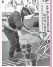
▲消火栓からの応急給水体験

時間・内容 午後0時半～1時=東京警察病院による災害時トリアージ(*)の解説 0時半～3時半=煙ハウス体験、応急給水体験、ハンド・マッサージ体験、起震車体験などを随時実施する他、中野消防署・消防団による、高齢者体験とAED(自動体外式除細動器)などを使った応急救護訓練 会場 明治大学・帝京平成大学の正面玄関前(中野4-21) ☆当日直接会場へ。雨天決行。ただし、内容変更の場合あり *トリアージ=災害時など多数の負傷者がいる状況で一人でも多く救うため、けがの程度に応じて治療を行うこと