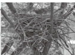
▲ハンガーで作られた巣