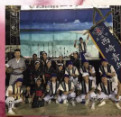
17日 糸漢市西崎青年会