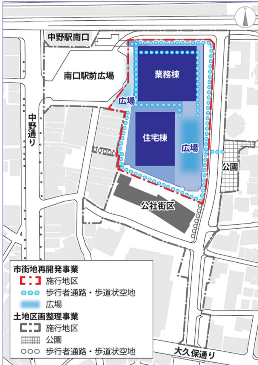
土地区画整理事業と市街地再開発事業の範囲（図1）