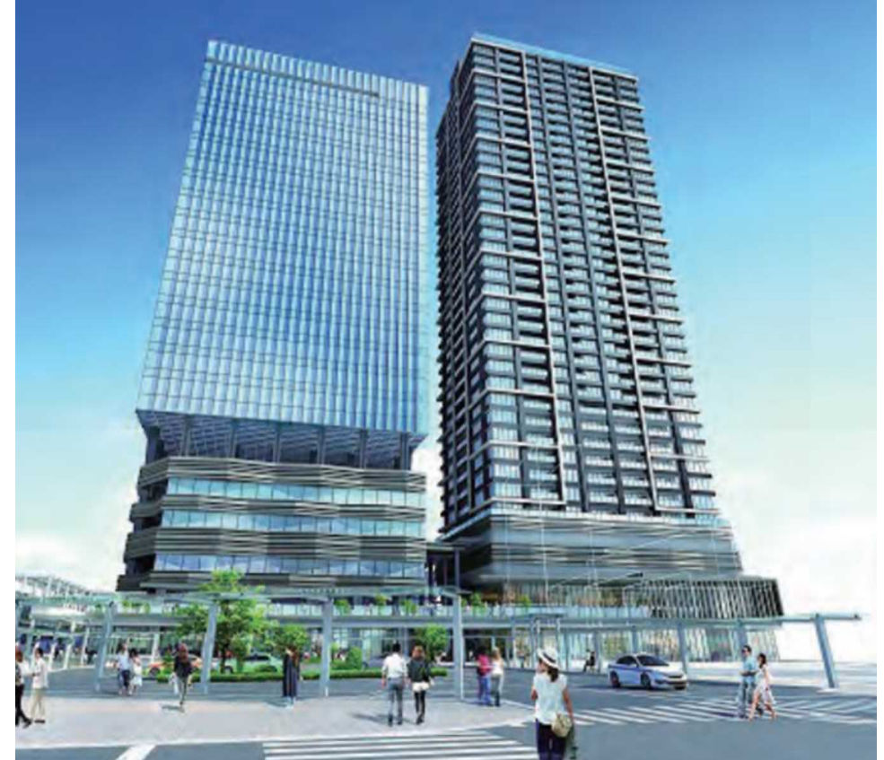
※パース図はイメージであり、今後の計画によって変更となる可能性がある。