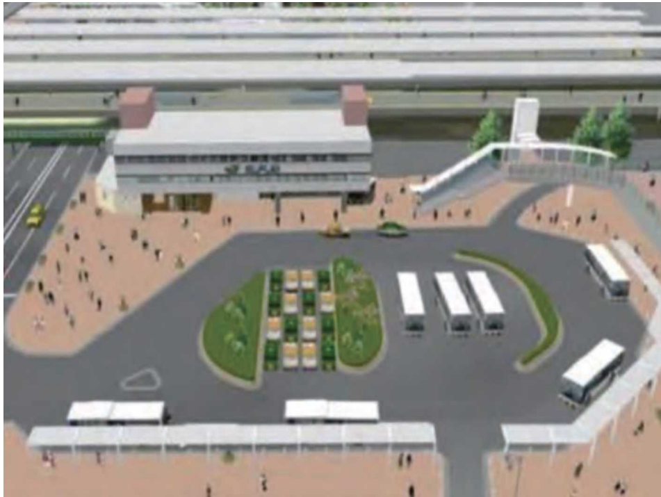
南口駅前広場の拡張整備イメージ