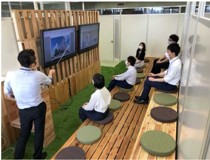
▲利用イメージ(プレゼンテーション)