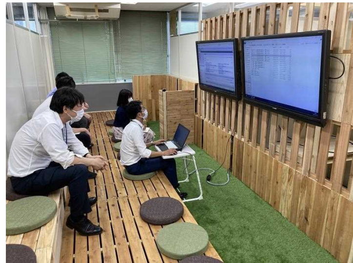
▲利用イメージ(資料の共有や協議の場)