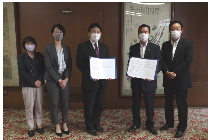
▲ 協定締結式の様子