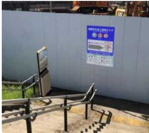
▲ 加熱式たばこ専用喫煙所

たばこのポイ捨て禁止や歩行喫煙防止の徹底を図るために、中野駅周辺の路上喫煙禁止地区の範囲を拡大するとともに、加熱式たばこ専用喫煙所を設置します。