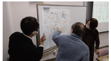
防災まちづくりの会の様子