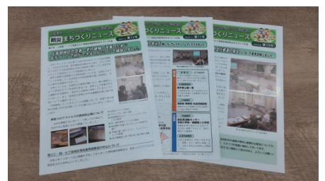
防災まちづくりニュースの発行