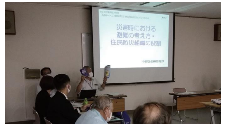
危機管理課レクチャーの様子