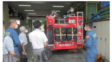
消防署ヒアリングの様子