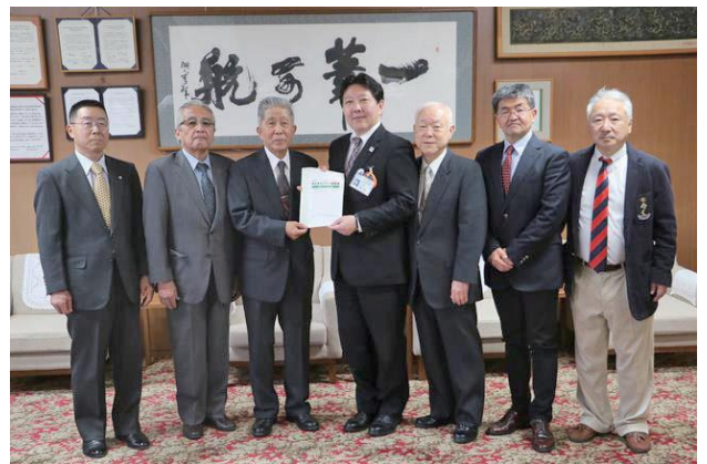
区長に「防災まちづくり提案書」を提出

なお、本提案書は、中野区のホームページからもダウンロードが出来ます。また、報告会にご参加の皆様には、本提案書をお配りいたします。