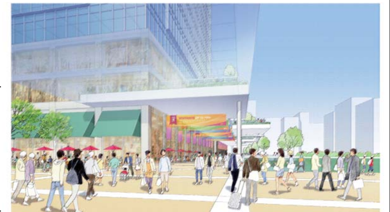
南北通路北側出口(デッキレベル)より