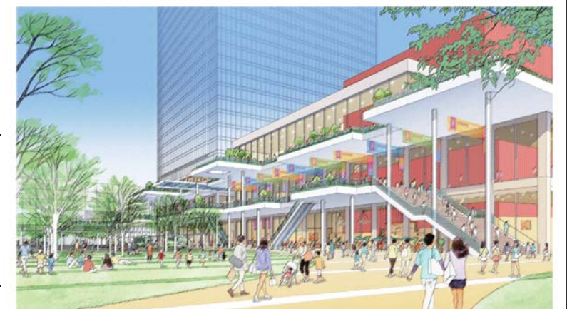
ホール前広場より