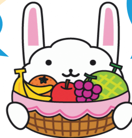
中野区食育マスコットキャラクター 「うさごはん」

うさごはんがこの条例 のポイントを解説してい るので、ひとつずつ見て いきましょう!