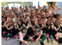
宝仙学園高等学校 女子部ダンス部 ReguLu's