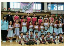
一輪車クラブ ミルキース