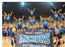
明治大学 男子チアリーディングチーム ANCHORS