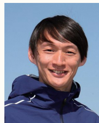
北京オリンピック 陸上男子4×100m リレー 銀メダリスト 高平慎士

正しい走り方など、あらゆる運動の基本となる「走り」をオリンピック銀メダリストが直接子どもたちに教えます。