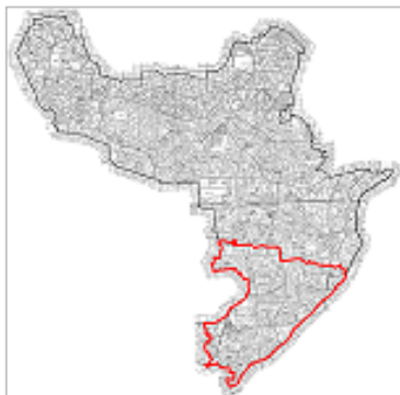
中野区南部地区の位置