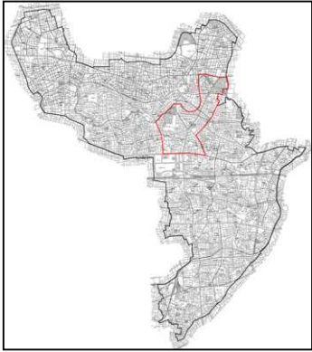
中野区新井・松が丘地区の位置