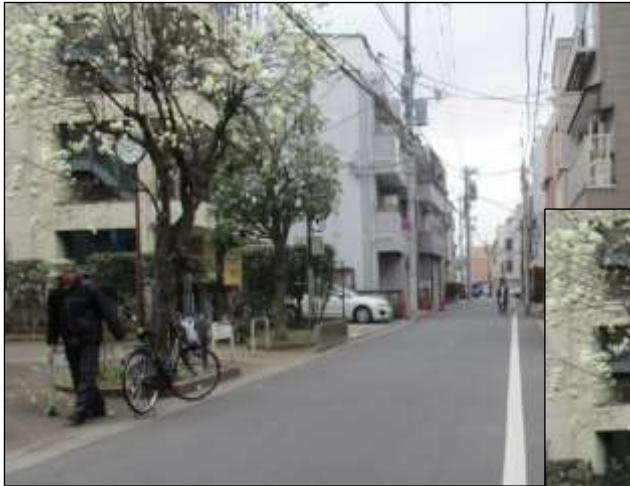
【現況写真】「無電柱化整備前（区道 12-910）」 弥生町三丁目

視線を遮る電柱や電線を無くし、都市景観の向上を図ることで、成熟したまちの魅力の発信に寄与する。