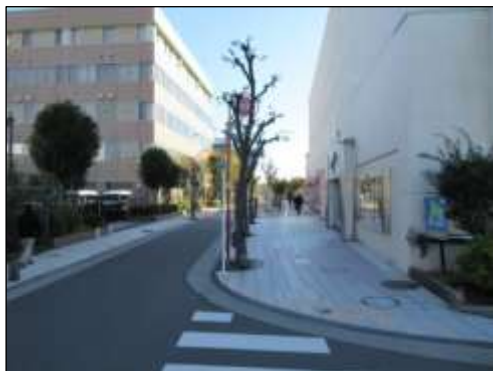
区道 24-100 (千光前通り)