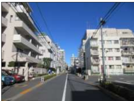
区道主幹1号（新橋通り）