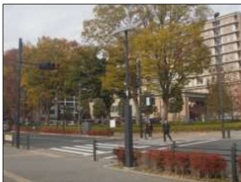
「区道の街路灯」(中野四季の都市)