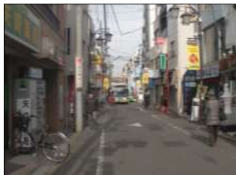
区道主幹10号（沼袋駅バス通り）