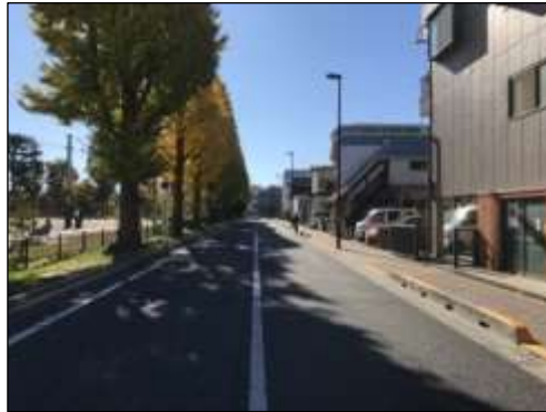
区道主幹 1号 (東大附属西側通り)