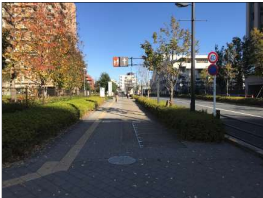
「広幅員の歩道整備により安全な歩行空間を確保（区道 22-460）」中野四季の都市

通行の支障となる電柱を排除し、道路の有効幅員を確保することにより、ベビーカーや車椅子利用者等の移動の円滑化を図る。