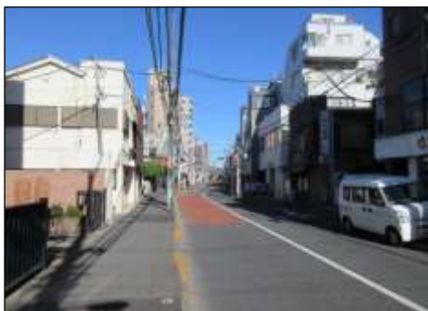
区道主幹4号（三味線橋通り）