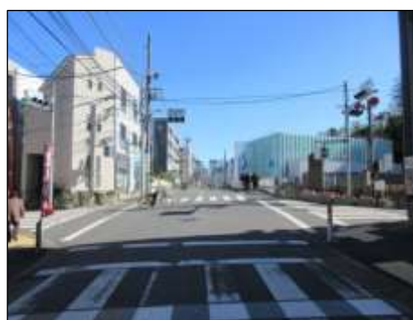
区道主幹2号（本郷通り）