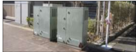
「無電柱化に伴い設置される地上機器」 区道主幹1号（東大附属西側通り）

無電柱化後の地上機器移設は困難であり、公有地の積極的な活用や用地取得により、設置場所を確保する。