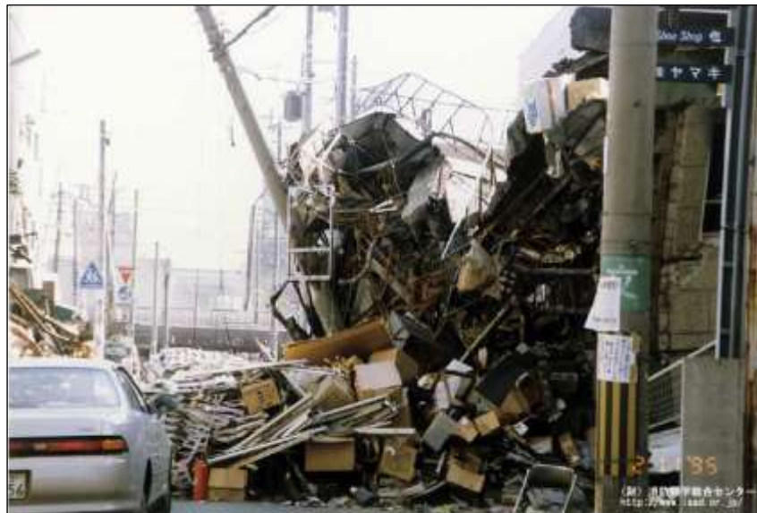
「阪神淡路大震災による電柱の倒壊状況」

災害時の電柱倒壊リスクを排除し、避難活動空間を確保するとともに、消防活動への支障を回避する。また、電線類の断線等の被災を軽減することで、電気や電話などのライフラインの安定供給を確保する。