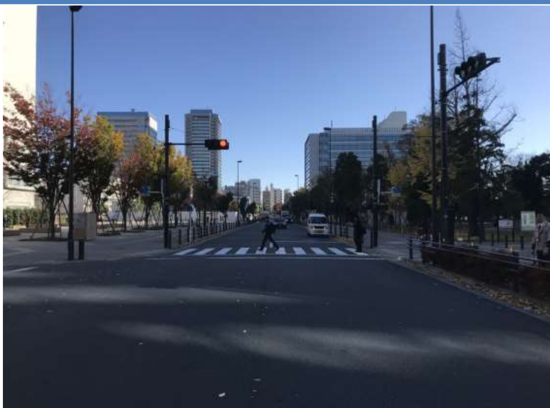
中野四季の都市（区道 22-450）