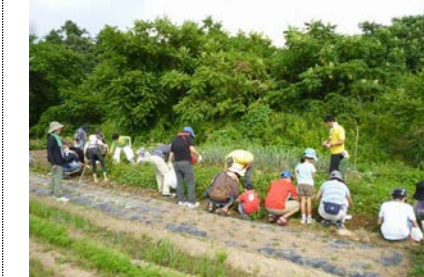
←交流事業での農業体験

○中野駅周辺は、にぎわいの中心として、業務・商業施設、住宅、教育機関などさまざまな施設が複合的に誘導され、広域避難場所としての機能とみどり豊かな空間を備えたまちとなっています。さらに、東京の新たな顔となるべく、サンプラザや区役所、中野駅北口広場一体の再整備や中野駅南口のまちづくりが動き始めています。