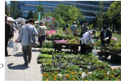
→ イベントでにぎわう四季の森公園