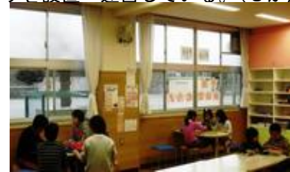
活動クラブ室の様子

小学生がのびのびと学年を超えて交流し、豊かな経験ができるよう「放課後の子どもたちの安心、安全な遊び場」として、区立小学校内にキッズ・プラザを設置・運営している。(8か所(平成25年度末現在))