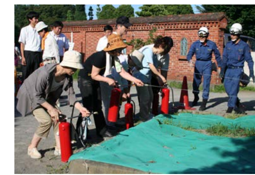
地域の防災訓練 避難所や地域住民防災組織等で地域の防災力強化のための訓練を実施している。

《関連する基本構想のまちの姿》 ○地域では、災害への対応や防犯のための備えなど、安全で、安心な暮らしを支えるための取り組みが、人々の力を生かしながら幅広く実践されています。