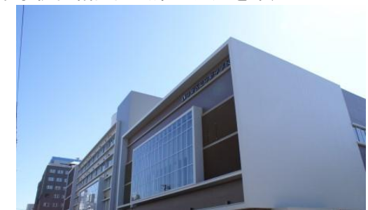
中野中学校→ 統合新校舎