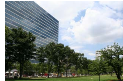
←業務ビル 麒麟株式会社本社等が移転（H25）

警察大学校等の移転に伴い、官民のパートナーシップに基づき一体開発を推進。業務ビル、大学、病院等が立地。防災公園の整備も進んでいる。昼間人口は2万人程度増加した。