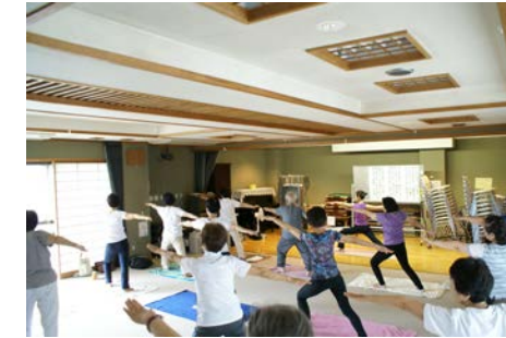
↑介護予防総合講座

《関連する基本構想のまちの姿》 ○高齢者が、体力づくりや食生活の改善など、自分に合った努力を行うことで、心身機能の低下の予防が進んでいます。