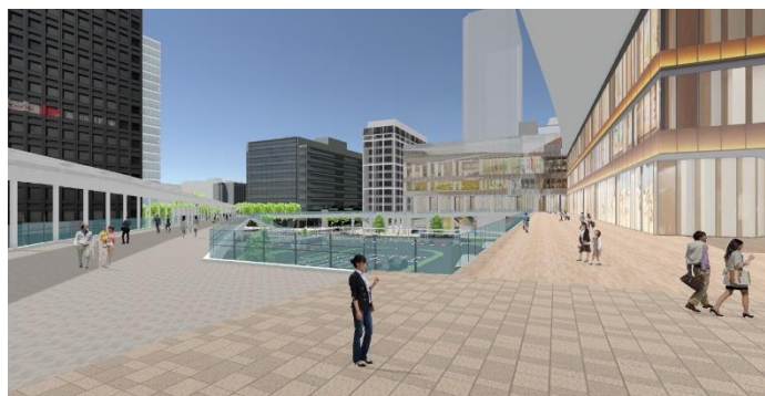
（新北口歩行者デッキ上）

普段、街に居るときと同様の歩く視線、上空から全体を見下ろす俯瞰の視線など、VR内を自由に動くことで街の様子を把握できるもの。