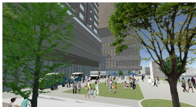
（中野二丁目地区・広場2号）