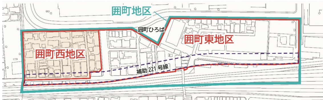
図1 囲町地区 全体図

この度、囲町西地区の権利者より、市街地再開発事業に係る一定の理解が得られ、事業計画等の認可申請を行うこととなったため、当地区におけるまちづくりの進捗状況について報告する。