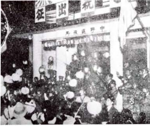
●日中戦争の戦果を祝う提灯行列(12年10月)