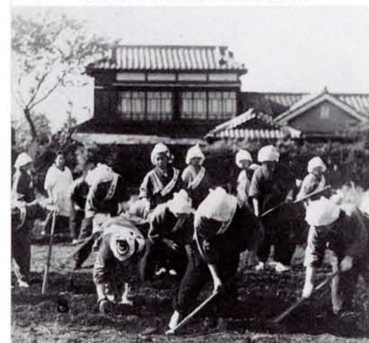
●隣組の防空演習、バケツリレー、1軒に必ず1人は出なければならなかった ●みんなで家庭菜園づくり。どんなに狭い空地も利用して (15年 大和町にて)