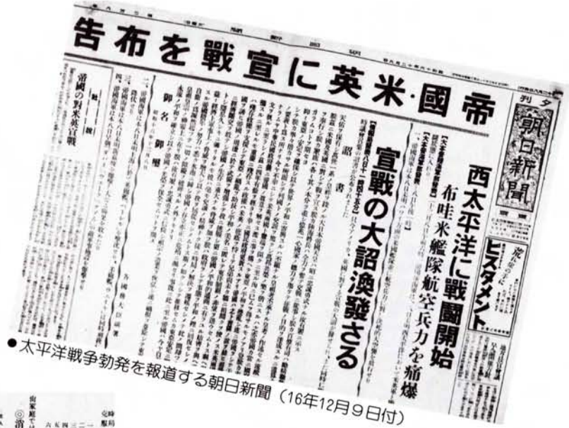
●太平洋戦争勃発を報道する朝日新聞(16年12月9日付)