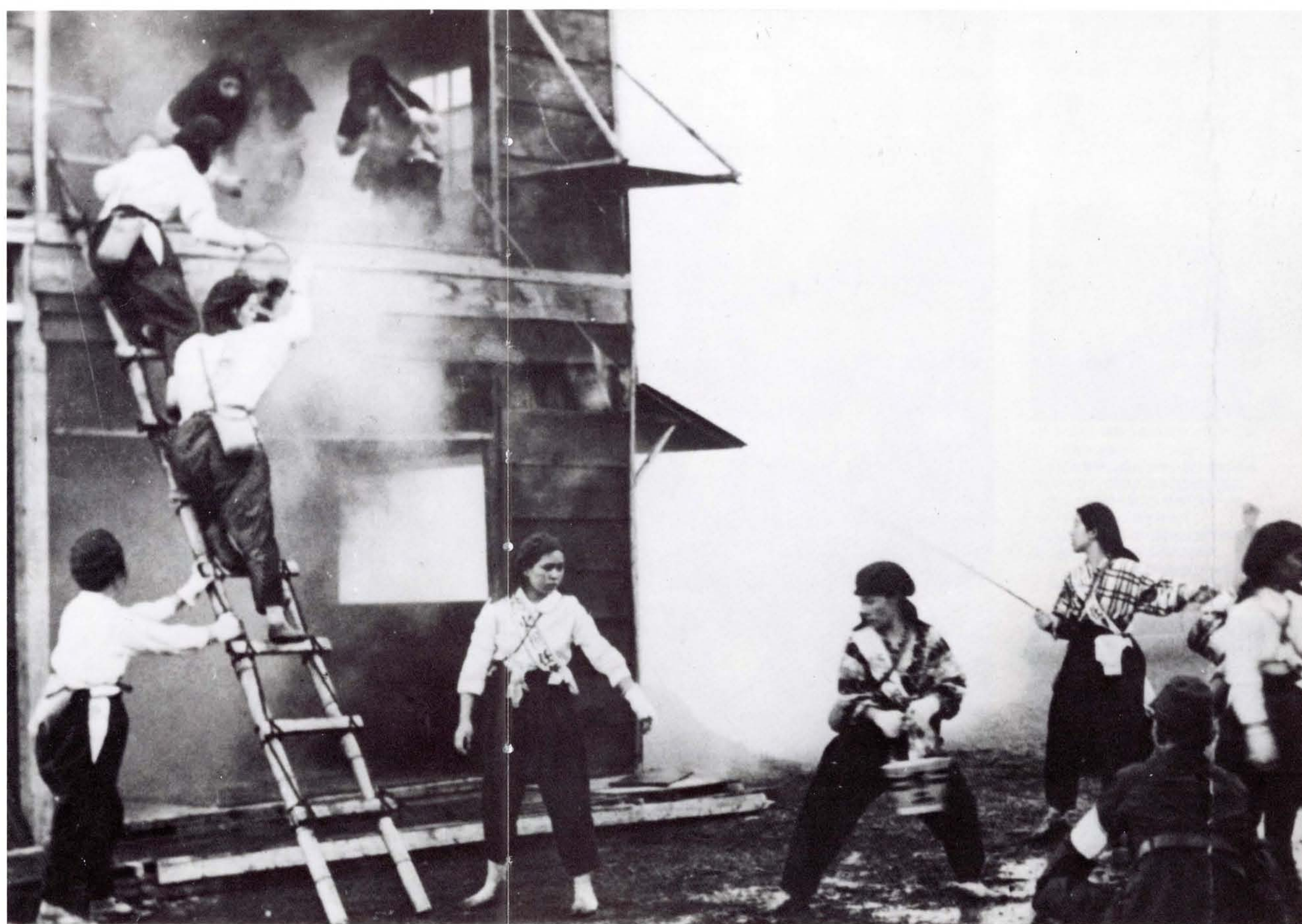
でもこの演習だけは、実際の空襲に役に立った。 本町通四丁目町会 (17年)