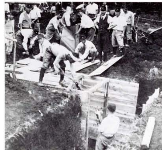
●防空壕づくり、隣組で力を出しあって。 こればかりは男性でなければ…。でも 男性がだんだん少なくなって (16年頃 現中野三丁目付近)