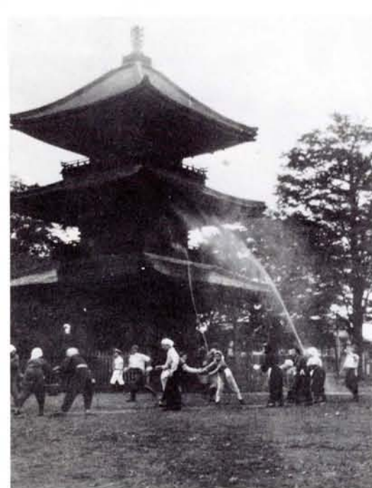
●まちを守り、文化財を守るために (塔山・三重塔にて)