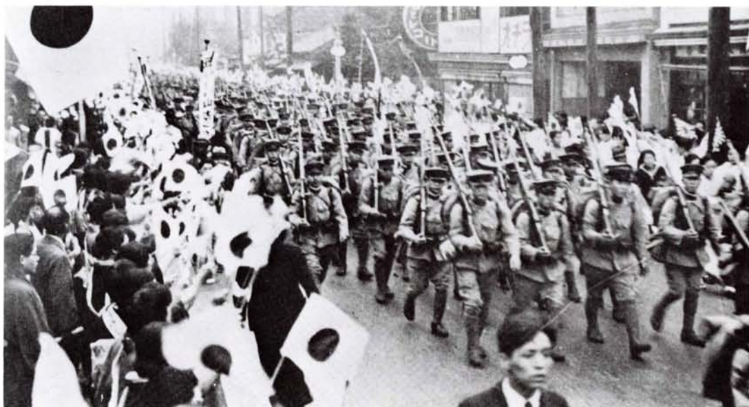
●満州に出発する兵士（12年）