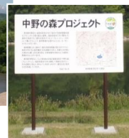
「中野の森プロジェクト」の看板道の駅「喜多の郷」