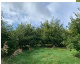
「中野の森」に植樹したコナラが育っています

2014年度に協定を締結し、みなかみ町の牧場跡地に設けた「中野の森」(約15ha)で年間約6千本、5年間で約3万本の植林を行いました。この植林により、群馬県から「森林整備によるCO 2 吸収量(11年間で596.1t)」の認証を受けました。