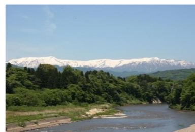
阿賀川のほとりから望む飯豊山

2015年度に協定を締結し、森林によるCO 2 吸収分のJ-クレジット(CO 2 吸収量)を11年間で720t-CO 2 購入することにより、中野区内でのCO 2 排出量とオフセット(埋め合せ)を行いました。このJ-クレジットを購入をすることで、喜多方市の森林整備(間伐)を支援しています。