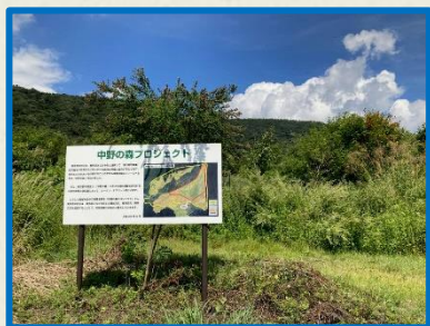
群馬県みなかみ町