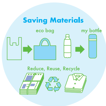
資源の有効利用など