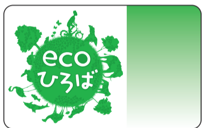
▲オリジナルICカード