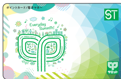
▲サミットポイントカード

4月2日(火)から サミットポイントカード サミットアプリで運用 開始致します。