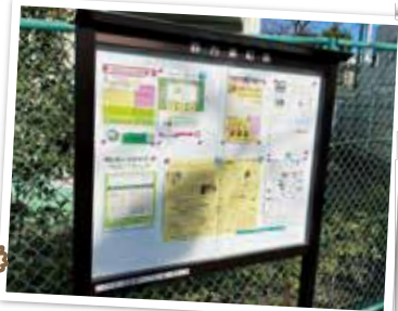
町会・自治会掲示板

町会・自治会の掲示板では、地域の行事や区からの情報など地域の皆様に役立つ情報を発信しています。