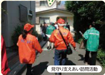
見守り支えあい訪問活動