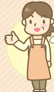
南中野地域在住 女性

参加のきっかけは、子どもの小学校のPTA活動を通じて町会活動に声をかけていただいたことです。今では知り合いも増え毎回楽しく参加させていただいております。子どもたちが大きくなって地域で安全に過ごせるのは町会活動のおかげということを理解してもらい、「自分たちも将来参加したい。」と思ってもらいたいです。