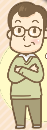
江古田地域在住 男性