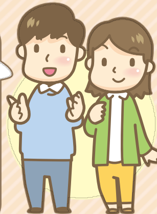
沼袋地域在住 夫婦

小学校の近くに自転車や大型バスが通る道路がありますが、町会の方々が子どもや歩行者が安全に渡れるよう横断歩道で旗振り誘導をしてくれるので安心して子育てができます。地域の方々に見守られていると実感しました！