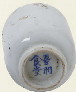
豊刑食堂の字入り 湯呑茶碗

大正4年(1915)に竣工した旧豊多摩監獄は、大正11年に「豊多摩刑務所」と名称を変え、監獄から刑を務める場となりました。翌12年の関東大震災で建物の多くが倒壊し、8年かけて昭和6年(1931)に復旧します。大正14年に制定された「治安維持法」では、共産主義思想、自由主義者や労働運動への取り締まりがおこなわれ、多数の思想家、共産主義者、労働運動家、文化人が収監されました。治安維持法と、収監された人々から中野にゆかりのある人々を中心に紹介します。