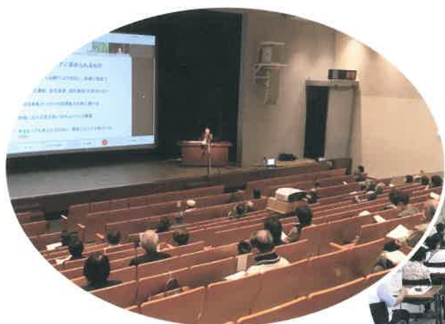
▲小ホールでの講義。ソーシャルディスタンスをとり、オンライン併用で実施