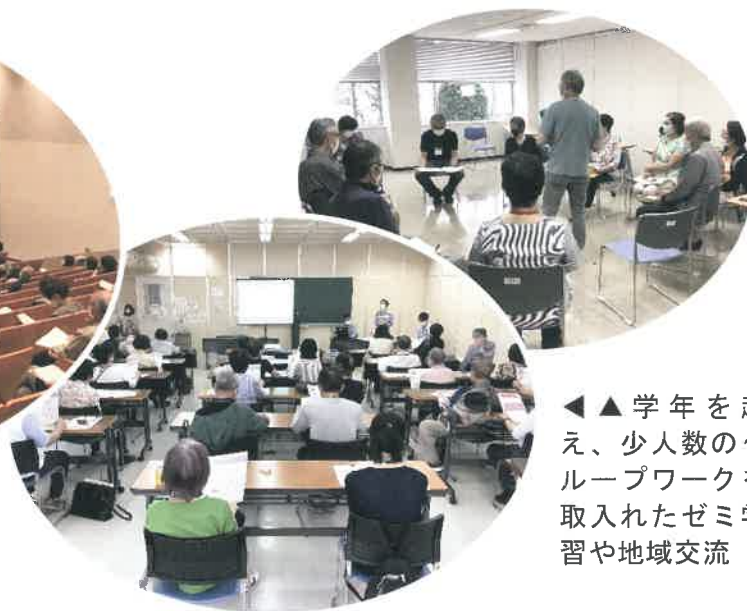
◀▲学年を超え、少人数のグループワークを取入れたゼミ学習や地域交流