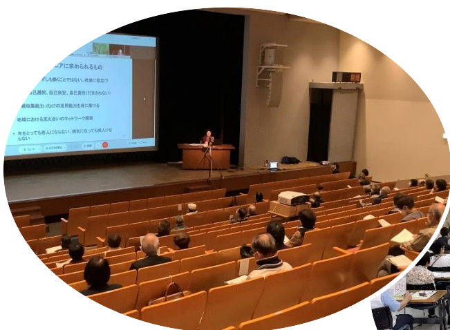
▲小ホールでの講義。ソーシャルディスタンスをとり、オンライン併用で実施