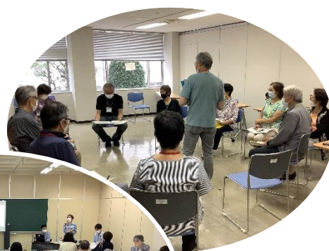
◀▲学年を超え、少人数のグループワークを取入れたゼミ学習や地域交流