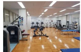
▲トレーニングルーム