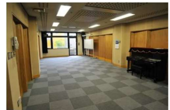
▲ミーティングルーム