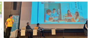
(2024年度居場所 × 中高生チームが提言)