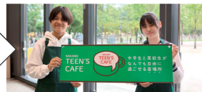
(2023年度中高生サポーターチームが提言)