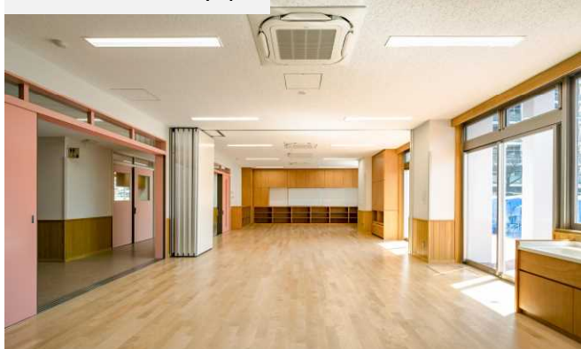
キッズ・プラザ令和

小学生がのびのびと学年を超えて交流し、豊かな体験ができる「放課後の子どもたちの安全安心な遊び場」として開設しています。