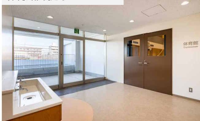
体育館開放用エントランス

体育館の一般利用に用いています。子どもたちが利用する部分と完全分離することができ、多目的な利用もできます。