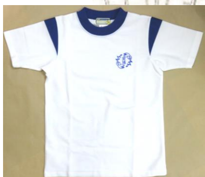
▲体育着シャツ (首元と肩に紺色のライン)