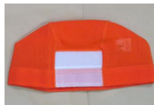
▲水泳帽子 (オレンジ)