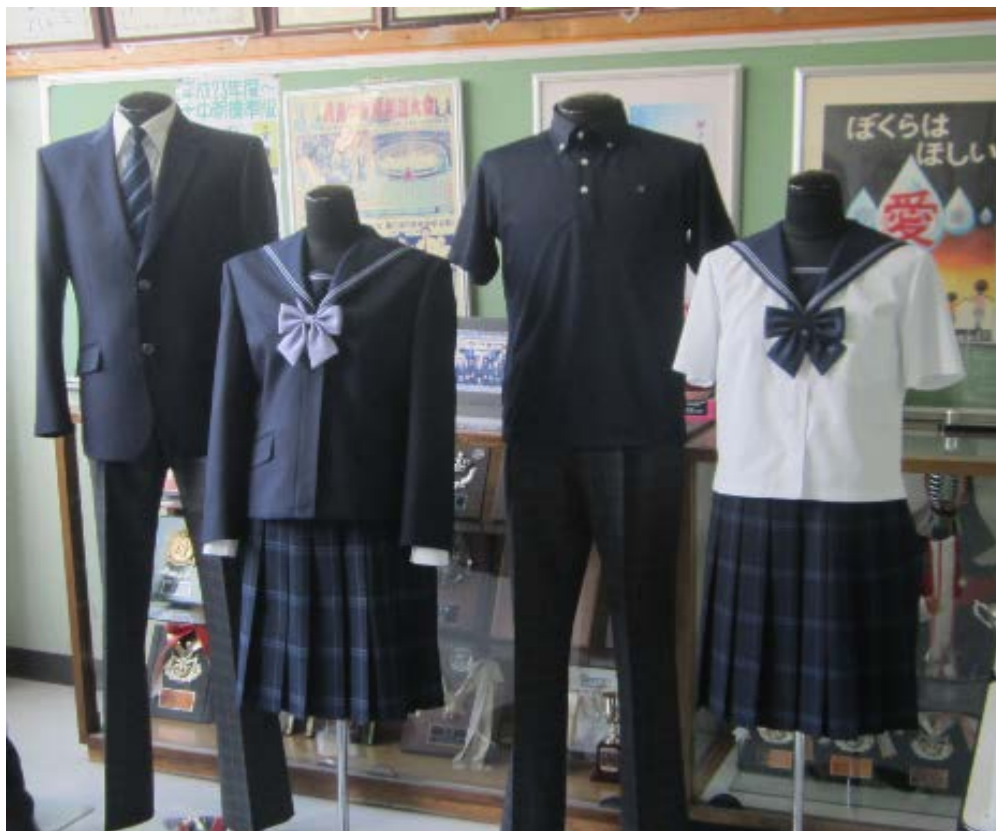
左が冬服、右が夏服の見本展示品

標準服については、統合委員会の中に「標準服検討部会」を設置して、検討を進めてきました。2～3月には両校で標準服候補展示会を各3日間にわたり開催し、児童・生徒や保護者、地域の皆様など来場者にアンケートを実施しました。両会場併せて200名余りの回答があり、標準服に関する様々なご意見を頂きました。