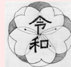
おうほ 応募されたもの

れいわしょう かみたかたしょう あらいしょう とうごうこう れい 令和小(上高田小・新井小の統合校)の例